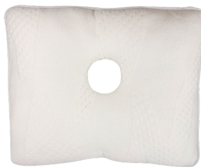
Imagem do produto:

A almofada anti-escaras previne o aparecimento de úlceras de pressão, consequência da permanência do corpo na mesma posição por longos períodos de tempo. As úlceras de pressão surgem principalmente em zonas de proeminência óssea e pontos de apoio do corpo, como calcanhares, glúteos, ombros, joelhos, cotovelos e bacia. A pressão excessiva sobre um ponto do corpo, limita a entrada de sangue nessa zona e consequentemente de oxigénio, provocando vermelhidão, destruição da derme/epiderme e consequentemente feridas superficiais ou profundas..